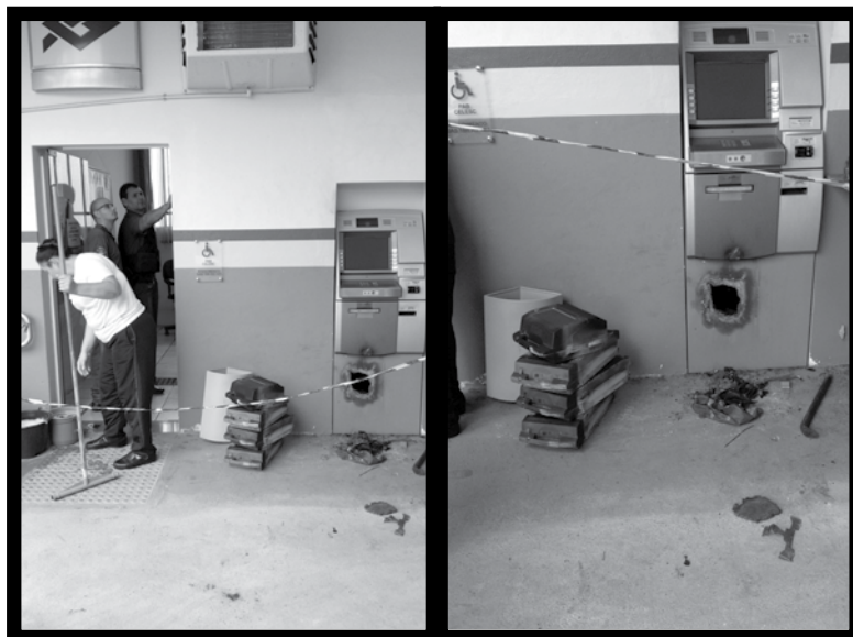
CAIXA ELETRÔNICO ARROMBADO NA AGÊNCIA REGIONAL DE JOINVILLE

Por meio da Celnet, a Regional de Joinville noticiou que "serão tomadas medidas preventivas como a transferência da posição da guarita, instalação de dois monitores 22 polegadas para monitoramento, bem como sensor de movimento nas câmeras e mais um ponto de vigilância no COS". Aparentemente nenhuma destas medidas representa efetivamente maior segurança para os trabalhadores, já que a administração não divulgou nenhuma ação para o local por onde a regional foi invadida nas duas vezes. Ainda na Celnet os trabalhadores parecem defender a permanência do caixa eletrônico na regional. Há manifestações inclusive de Itajaí, onde uma tentativa de assalto fez com que o caixa fosse desativado. A única manifestação pela retirada foi rechaçada com violência, enquanto há também apenas uma manifestação que cobra maior investimento em seguranças (e não só em tecnologia). O fato que é imperativo que mudanças sejam realizadas pela Celesc para que os trabalhadores estejam verdadeiramente protegidos. A conveniência e a facilidade de se ter um posto bancário e um caixa eletrônico nas Agências da Celesc não pode significar ameaças a trabalhadores.