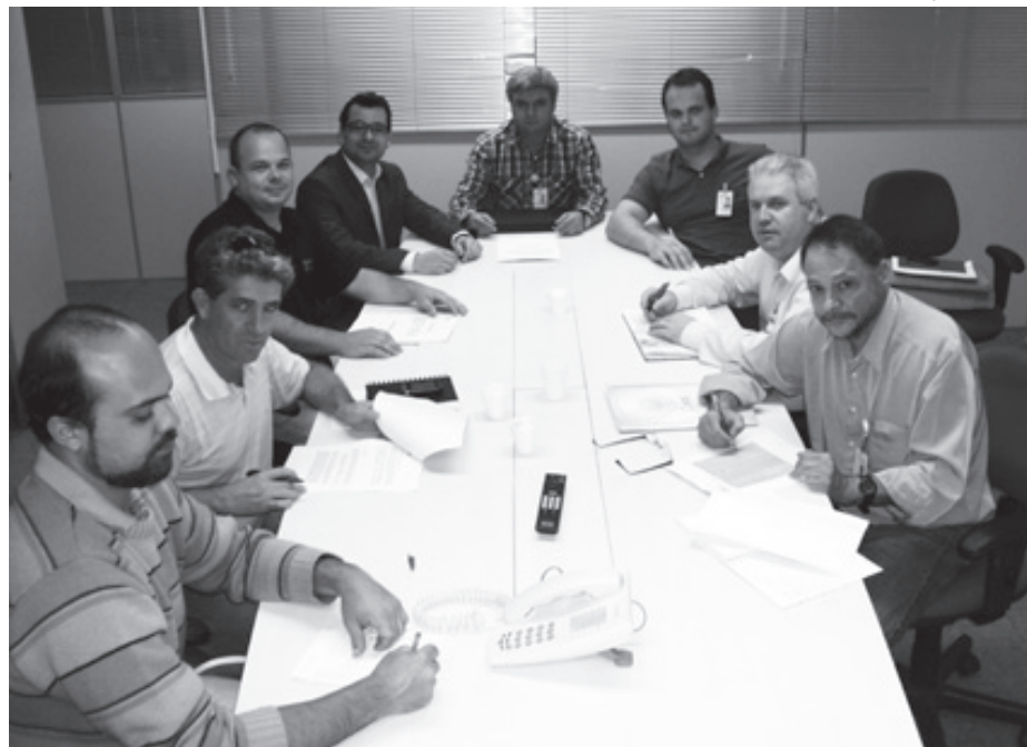
Grupo de trabalho com participação da Intercel concluiu os trabalhos de análise da NR10