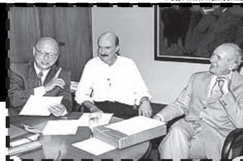
Ex-presidente da Celesc (c) afirmou durante data-base que trabalhador "não valia um tiquete"

-refeição. Em 2001 o percentual de participação do trabalhador é alterado para 1%, 10% e 15% e em 2003 para 0,5%, 5% e 10% que permanece no acordo de 2004. Foi só a partir de 2005 que estabelecemos a participação simbólica de R$ 1,00 que consta dos acordos atuais. Outra conquista importante ocorreu no acordo de 2006 quando a empresa pela primeira vez contratou, através de Termo de Compromisso, o "tiquete-peru" ou décimo-terceiro que já era concedido em outras concessionárias do setor elétrico. No ano passado essa conquista passou a integrar o acordo coletivo de trabalho tornando-se um direito dos trabalhadores. Enfim, uma necessidade fundamental do ser humano que é alimentar-se adequadamente para bem exercer suas atividades laborais, só pôde ser garantida e aperfeiçoada com muita luta e organização dos trabalhadores.