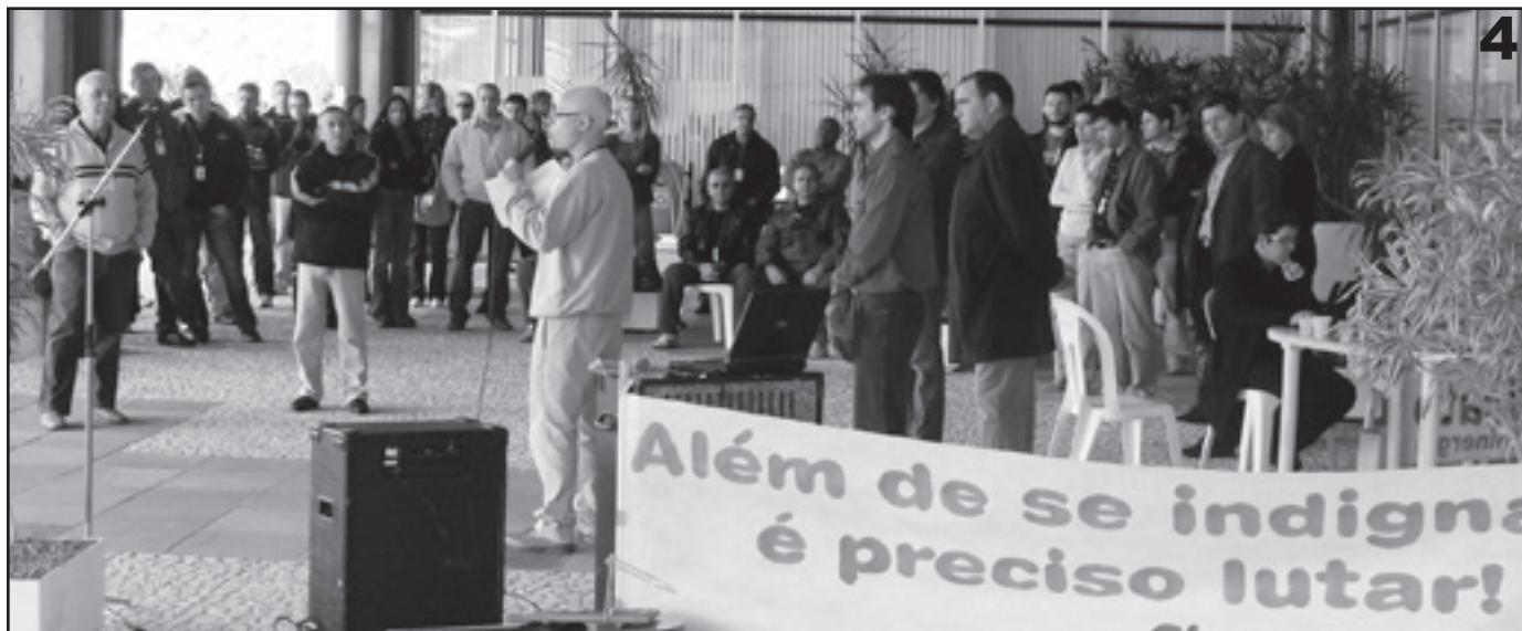
Trabalhadores da Eletrosul em várias manifestações: 1 e 2 - manifestação na sede da empresa, em 2005. 3 - Trabalhadores da Eletrosul Oeste paralisados em 2008. 4 - Paralisação em 2011.